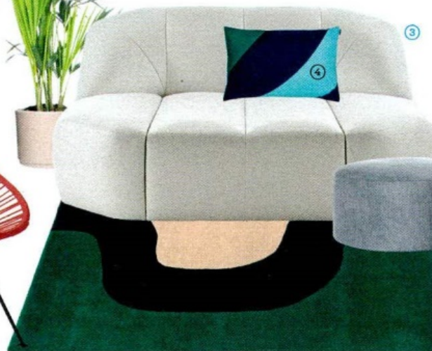
Un motivo Anni '60 nel TAPPETO Seireeni [Marimekko, cm 170x240 € 845].