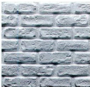
PANNELLO decorativo a effetto cortina di mattoni [MuroForm].

In un ambiente luminoso, gioca con i colori neutri e i tocchi pastello e inserisci texture a rilievo nelle pareti.