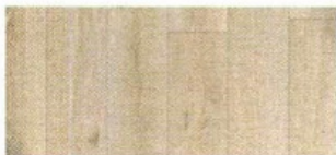
PAVIMENTO in ceramica effetto legno Sigurt Wood Scandinavian Oak [RAK Ceramics, cm 19,5x120].

Velluto nero diffonde un'essenza inebriante e avvolgente [Caleffi, 100 ml, da € 13,90]. | EG