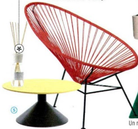
Anni '50 la POLTRONCINA Acapulco [OK Design, cm 100x71x87h € 379].

Velluto nero diffonde un'essenza inebriante e avvolgente [Caleffi, 100 ml, da € 13,90]. | EG