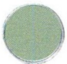
IDROPITTURA lavabile Alphacryl Pure Mat colore J3.14.63 [Sikkens].